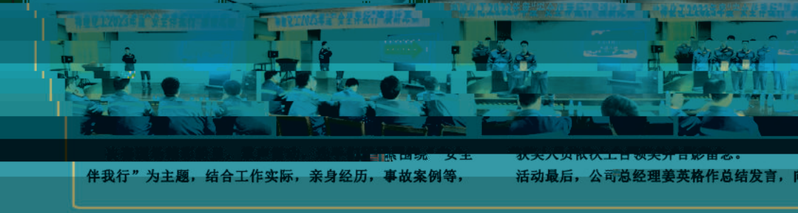
演讲比赛复赛现场，选手们激情演讲，评委们认真聆听。复赛活动在公司范围内掀起了“安全伴我行”的热潮。

本次比赛共有60名职工参赛，各单位领导高度重视，积极组织参赛。选手们结合自身工作实际，围绕“安全伴我行”主题，讲述了一个个感人至深的故事，传递了“安全第一、预防为主”的核心理念。复赛活动在公司范围内掀起了“安全伴我行”的热潮，营造了浓厚的安全文化氛围。